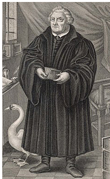
Fig. 4. «Luther med svanen», kopperstikk av Jacob von Sandrart, Nürnberg.

vite hvorfor ? Hva fikk kunstneren til å male ei gås i stedet for en svane? Vitenskapen kan hjelpe malerikonserveratorer til å finne svar, men vitenskapen er ikke en tidsmaskin, og av og til reiser analysene flere spørsmål som vil være ubesvart for alltid. Dette er vitenskapens begrensing, så langt kan vi komme. Noen ganger må vi bare godta usikkerhet og forbli ydmyke i møtet med fortidens mystikk.